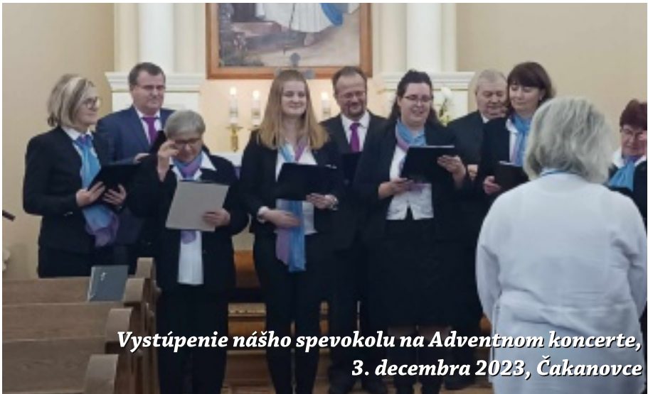
Vystúpenie nášho spevokolu na Adventnom koncerte, 3. decembra 2023, Čakanovce

Podobných nálezov je ešte mnoho, a niekedy nabudúce sa o nich dočítate viac aj na stránkach Slova. ■