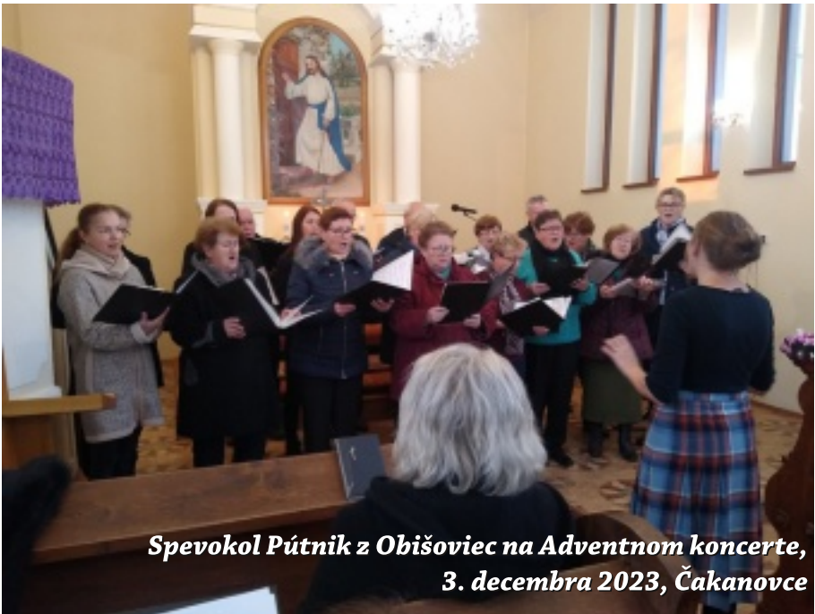
Spevokol Pútnik z Obišoviec na Adventnom koncerte, 3. decembra 2023, Čakanovce

Luther ukázal svojou Formulou Missae jasný smer, ktorým sa bude liturgický pohyb v evanjelickej cirkvi ďalej uberať. Za 30 rokov od jej vydania sa podľa nej objavilo viac než 135 rôznych bohoslužobných poriadkov odlišných od seba iba menšími detailmi. ■