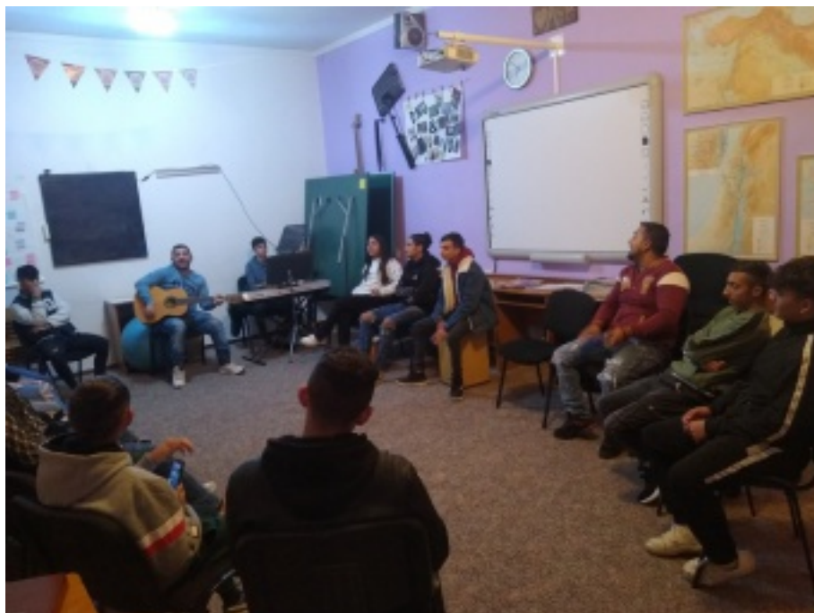
Stretnutie rómskeho dorastu, 2. novembra 2023, Rankovce