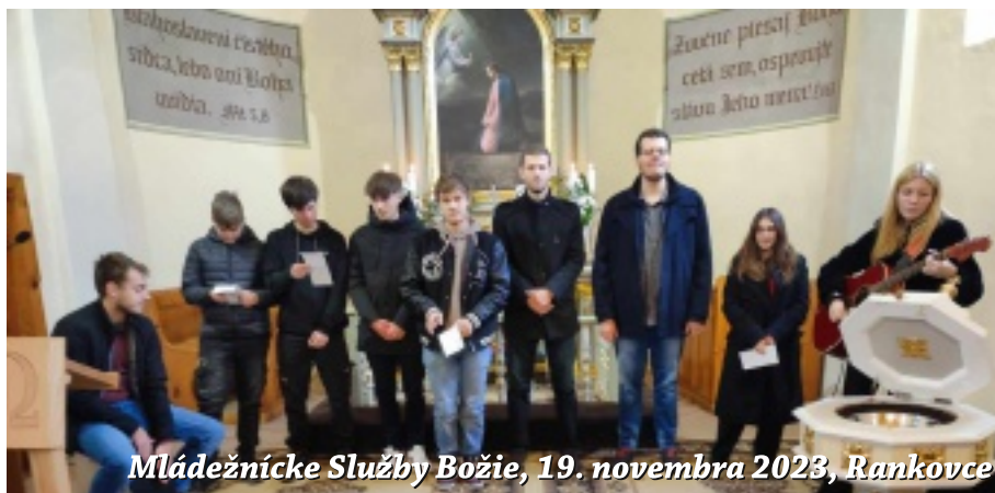
Mládežnícke Služby Božie, 19. novembra 2023, Rankovce

Pán Ježiš má monopol na záchranu človeka, je jediným Spasiteľom. A môže si protimonopolný úrad tvrdiť čo len chce, toto jednoducho ostane pravdou. A ak vám niekto povie, že ste netolerantní, keď hovoríte o jedinečnosti Pána Ježiša Krista, tak áno, ste netolerantní, ale aj tak je to jediná pravda, ktorá v tomto svete platí. ■