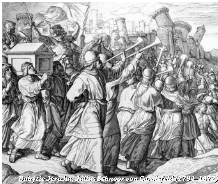
Dobytie Jericha, Julius Schnoor von Carolsfeld (1794–1872)