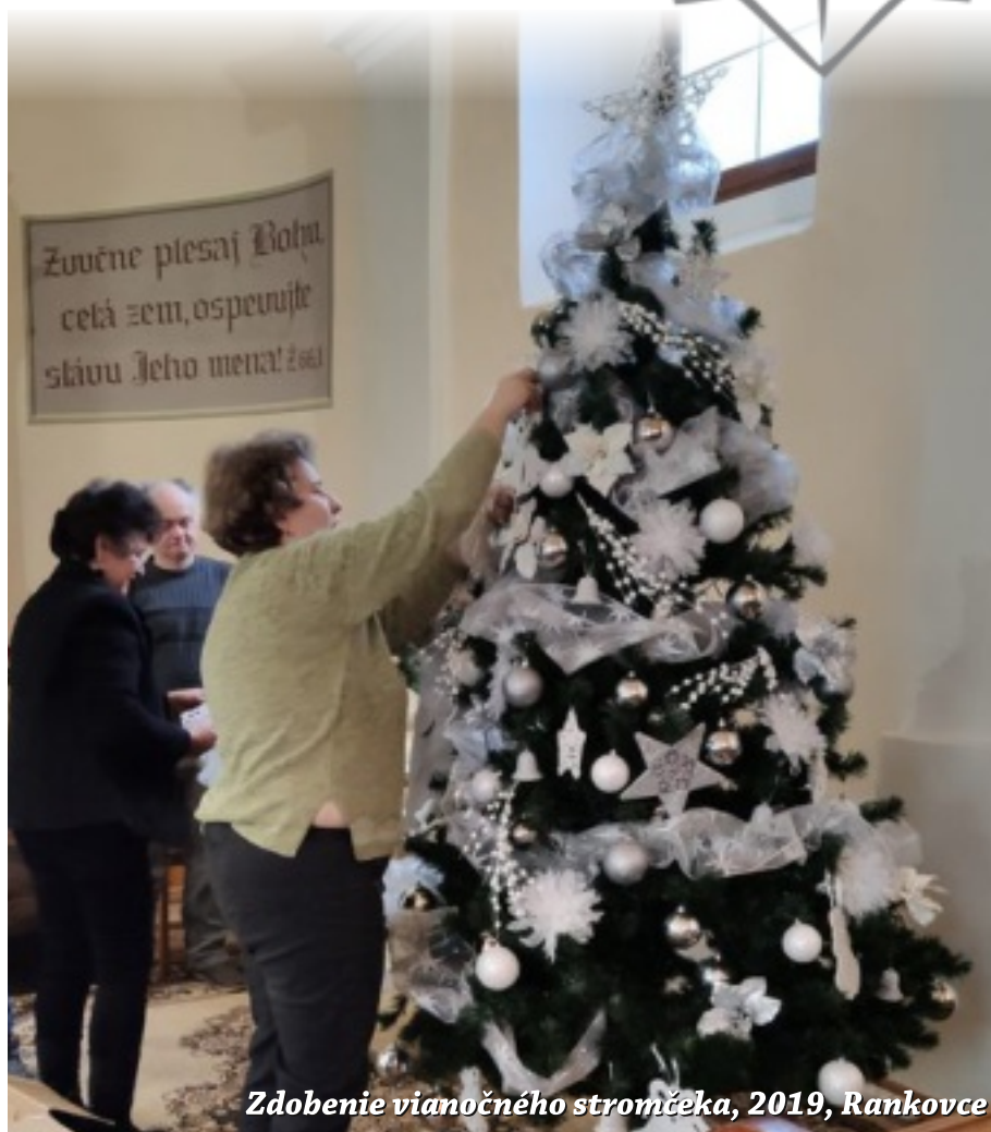
Zdobenie vianočného stromčeka, 2019, Rankovce