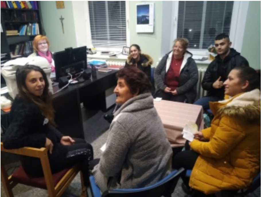
Stretnutie tímu vedúcich rómskej besiedky, 3. decembra 2023, Rankovce